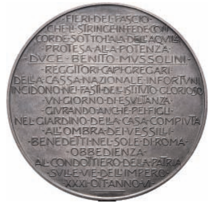
752 Medaglia opus Giorgi. Æ gr. 85,13 mm 50,8 Busto a s. Rv. Scritte in otto righe. Rizzino 100; Camozzi 1814. Colpo. Spl 80