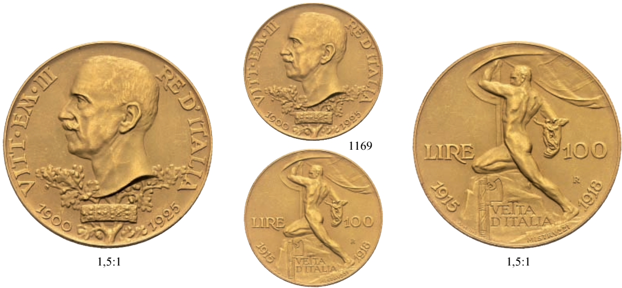
1169 100 Lire 1925 Vetta d'Italia . Au Pag. 645; Gig. 8.