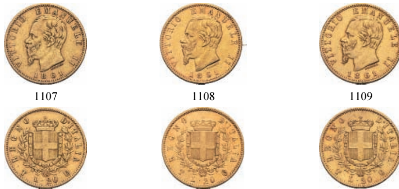
1107 20 Lire 1861 Torino. Au Pag. 455; Gig. 5. BB 280 1108 20 Lire 1861 Torino. Au Pag. 455; Gig. 5. Raro. Mínimo colpetto. Buon BB 300 1109 20 Lire 1861 Torino. Au Pag. 455; Gig. 5. Raro. Mínimo colpetto. Buon BB 300