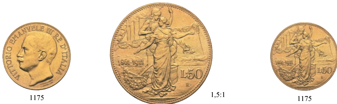
1175 50 Lire 1911 Cinquantenario . Au Pag. 656; Gig. 19.