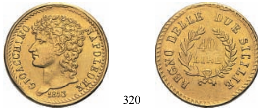
320 Gioacchino Murat, 1808-1815. 40 Lire 1813 rami corti. Au Pag. 55; Pannuti-Riccio 9; Gig. 8. Bel BB 800