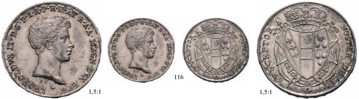
116 Mezzo Francescone 1828 . Ar Pag. 123; Gig. 27.