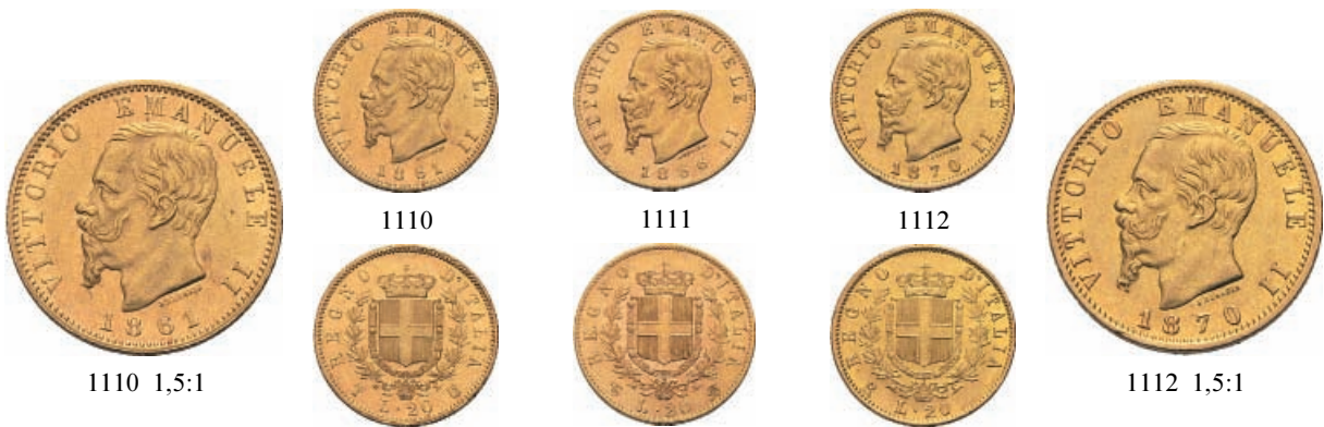
1110 20 Lire 1861 Torino. Au Pag. 455; Gig. 5. Raro. Spl 400 1111 20 Lire 1866 Torino. Au Pag. 460; Gig. 10. Raro. Più che Spl 270 1112 20 Lire 1870 Roma. Au Pag. 464; Gig. 14. Rarissimo. Colpetti. q. Spl 1500