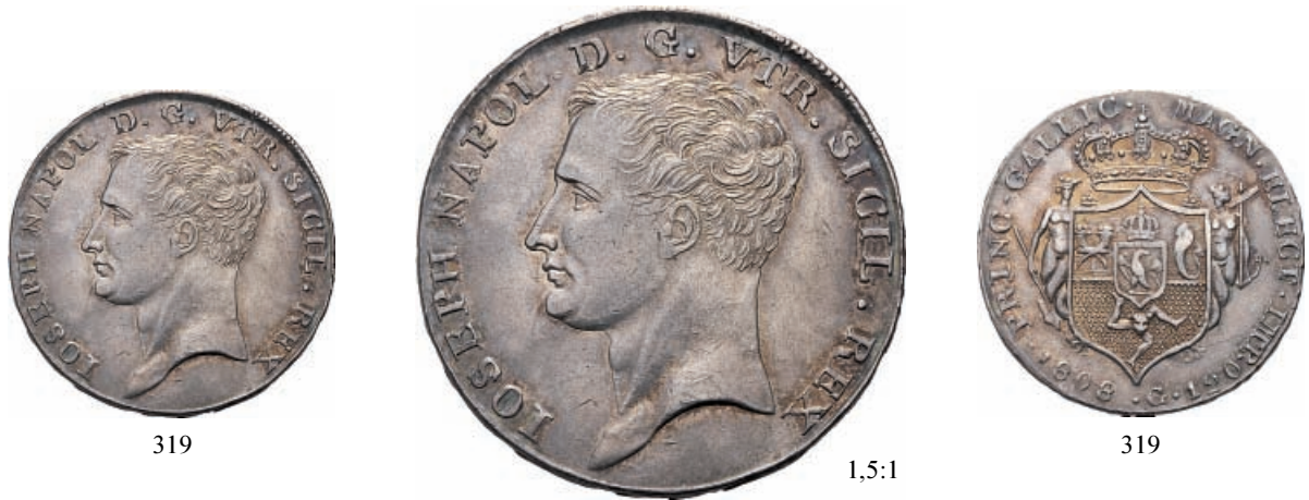
319 Giuseppe Napoleone, 1806-1808. Piastra 1808. Ar Pag. 43; Pannuti-Riccio 3; Gig. 3. Rara. Delicata patina. Spl 800