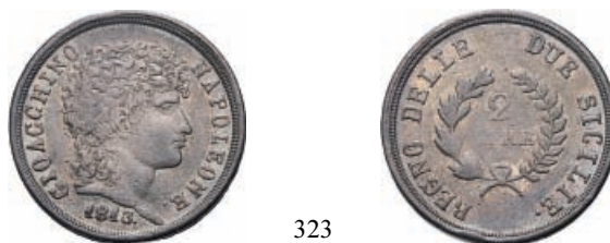
323 2 Lire 1813. Ar Pag. 60/c; Pannuti-Riccio 15; Gig. 13. Raro. q. BB 100