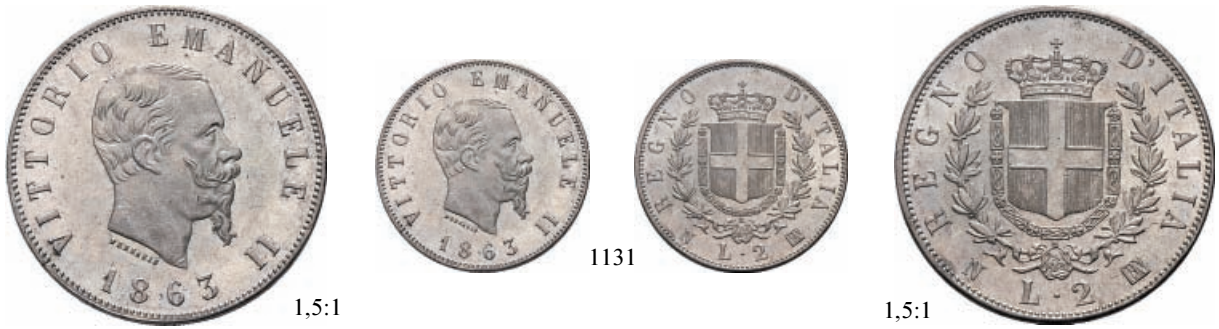
1131 2 Lire 1863 Napoli Stemma. Ar Pag. 506; Gig. 56.