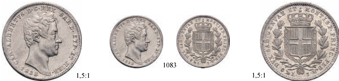
1083 Lira 1838 Genova. Ar Pag. 301; Gig. 125. Molto Raro. Difetto ore 15 al rv. Fondi brillanti. Più che Spl 800