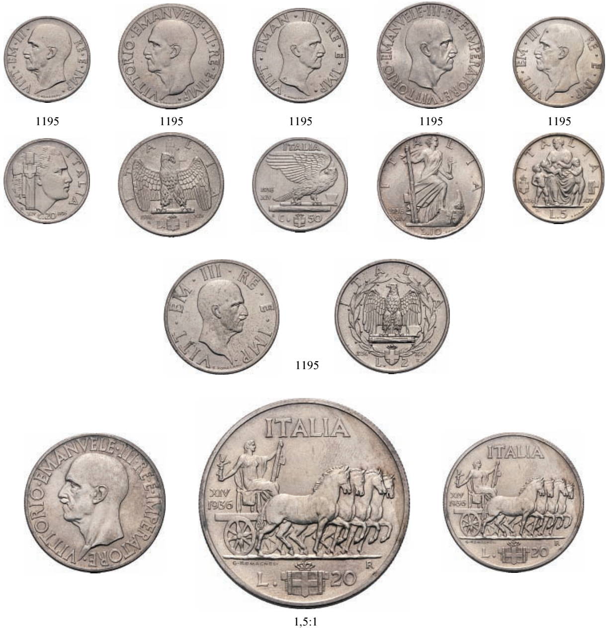
1195 Serie 1936 Impero a. XIV comprendente: 20 Lire, 10 Lire, 5 Lire, 2 Lire, Lira, 50 Centesimi e 20 Centesimi. Ar e Ni Pag. 681, 700, 719, 754, 789, 818 e 853; Gig. 45, 64, 83, 118, 153, 182 e 217.