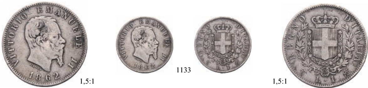
1133 Lira 1862 Torino. Ar Pag. 513; Gig. 63.