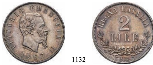
1132 2 Lire 1863 Napoli Valore. Ar Pag. 508; Gig. 58.