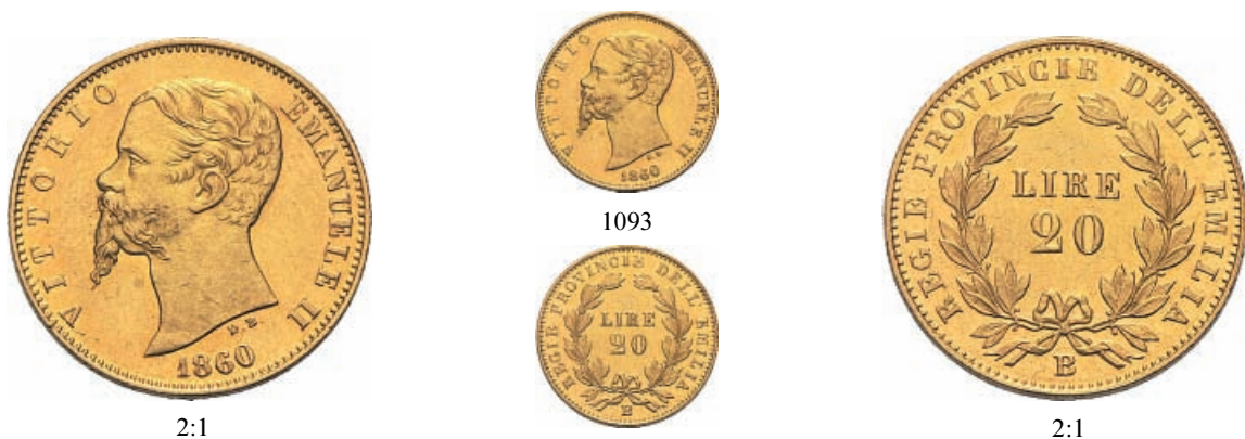
1093 Vittorio Emanuele II Re Eletto, 1859-1861. 20 Lire 1860 Bologna. Au Pag. 430; Gig. 1. Estremamente Raro. Coniato in 159 esemplari. q. Fdc