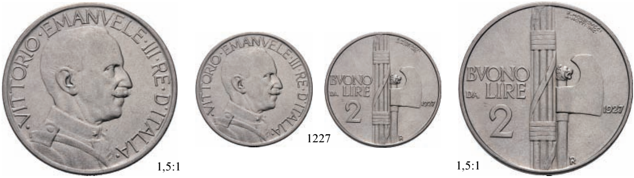
1227 Buono da 2 Lire 1927 Fascio. Ni Pag. 745; Gig. 109.