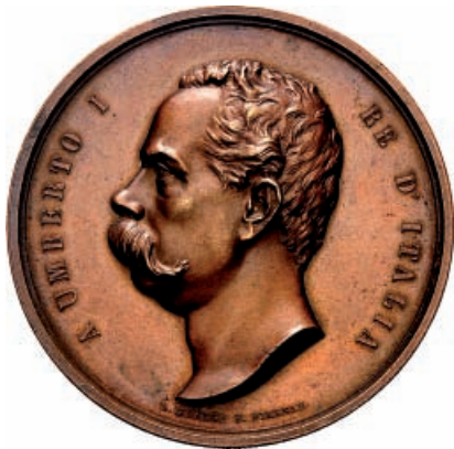
751 Medaglia 1885 opus Giovanni Vagnetti. Æ gr. 117,95 mm 60 Testa a s. Rv. La Giustizia e la Carità. Rara. q. Spl 70