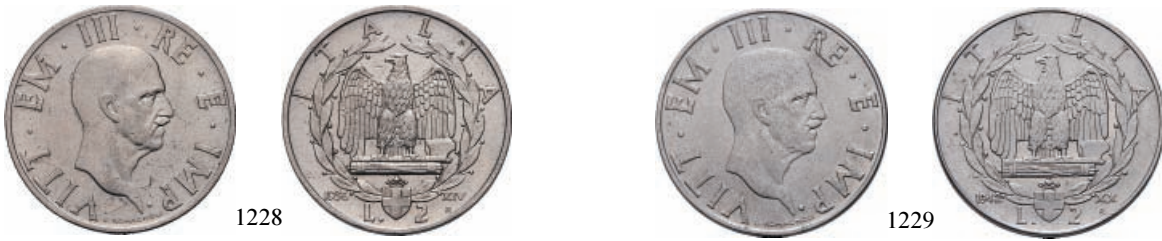
1228 2 Lire 1936 a. XIV Impero. Ni Pag. 754; Gig. 118.