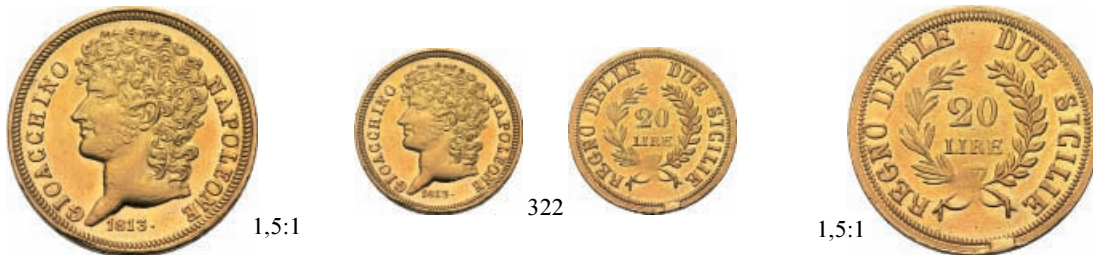
322 20 Lire 1813 rami lunghi. Au Pag. 56/a; Pannuti-Riccio -; Gig. 9c. Raro. Splendido esemplare 1000