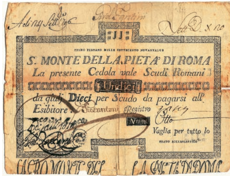
ex 1309 1:2

La carta moneta comparve nello Stato Pontificio nel corso del pontificato di Pio VI a causa della penuria di moneta metallica. Furono il S. Monte della Pietà ed il Banco di S. Spirito a curare l'emissione di "cedole" in scudi romani, del tutto simili fra loro ma costituenti una varietà complessiva di oltre duecento tipi, stante, in primo luogo, la distinzione fra i due istituti, quindi quella per tagli (da 3 a 3000 scudi) e poi per date di emissione (comprese fra il 1785 ed il 1797). L'inevitabile inflazione prodotta dalla grande quantità di cedole emesse fu affrontata dalla sopravvenuta Repubblica Romana con la demonetizzazione dei tagli più alti e la riduzione di valore degli altri. Finalmente, abbandonata a se stessa, la carta perdette ogni valore con danno economico ripartito fra i suoi detentori.