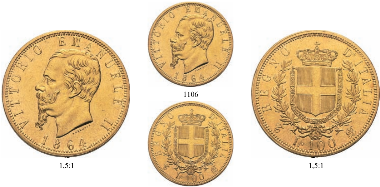
1106 Regno d'Italia. Vittorio Emanuele II, 1861-1878. 100 Lire 1864. Au Pag. 451; Gig. 1. Rarissimo. q. Spl 12000