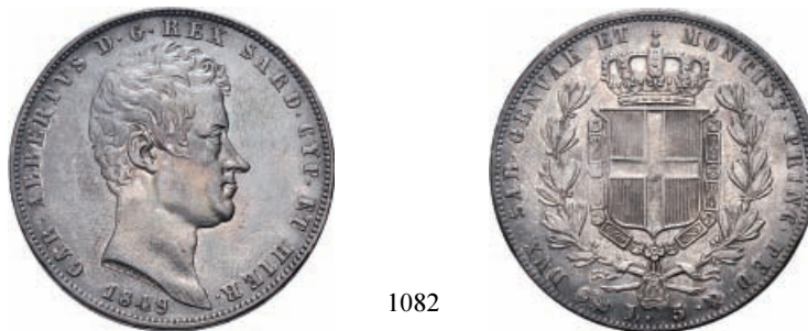
1082 5 Lire 1849 Genova. Ar Pag. 265; Gig. 89. Patina scura. q. Spl 200