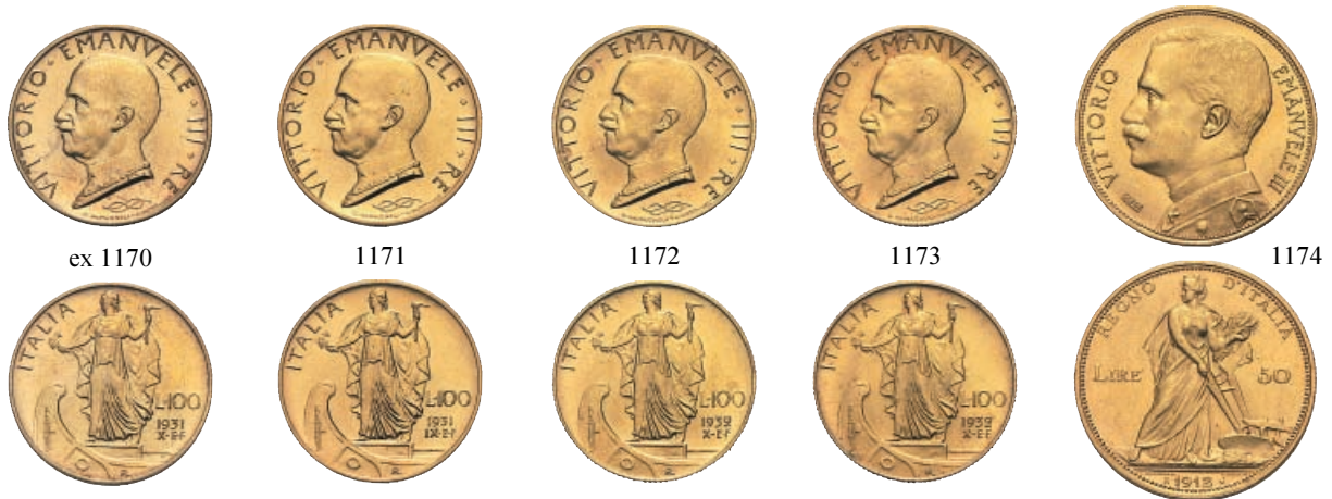
1170 100 e 50 Lire 1931 a. X. Au Pag. 647 e 658; Gig. 10 e 21.