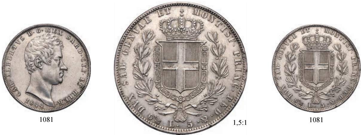
1081 5 Lire 1844 Genova. Ar Pag. 255; Gig. 79. Più di Spl 400