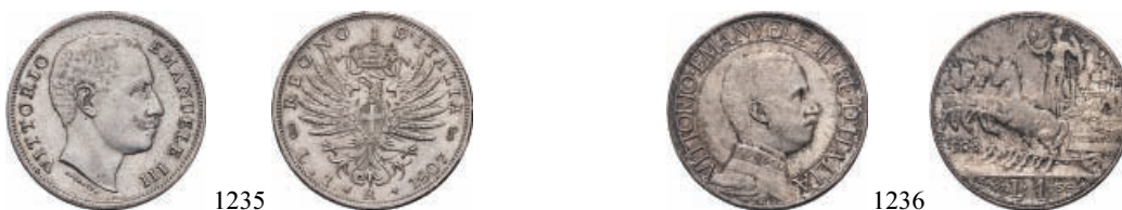
1235 Lira 1907 Aquila sabauda. Ar Pag. 767; Gig. 131.