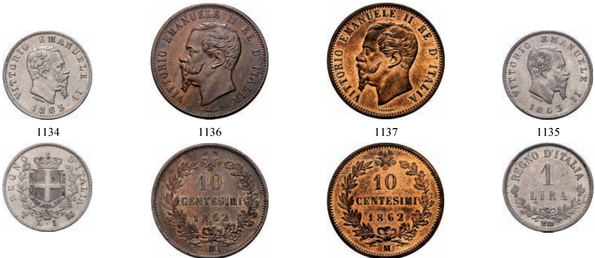
1134 Lira 1863 Torino Stemma. Ar Pag. 515; Gig. 65.