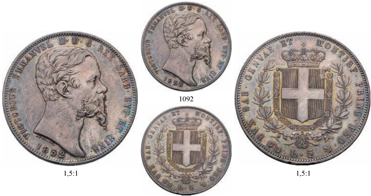
1092 5 Lire 1852 Genova. Ar Pag. 374; Gig. 34.