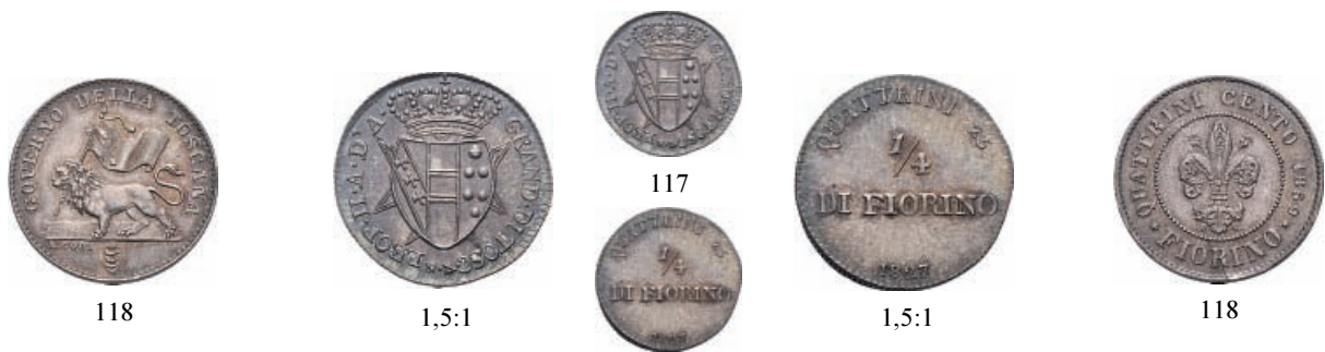
117 1/4 di Fiorino 1827 . Ar Pag. 154; Gig. 45.