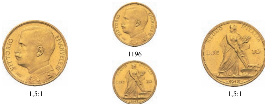
1196 10 Lire 1912 Aratrice. Au Pag. 688; Gig. 52.