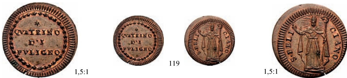
119 Prima Repubblica Romana, 1798-1799 . Quattrino . Æ gr. 1,96 Scritta in tre righe. Rv. San Feliciano in piedi col capo mitrato e radiato. CNI 2; Munt. 59; Pagani 24. Bruni 3.

Molto raro. Rame parzialmente rosso. Spaccatura di conio. q. Fdc 1000