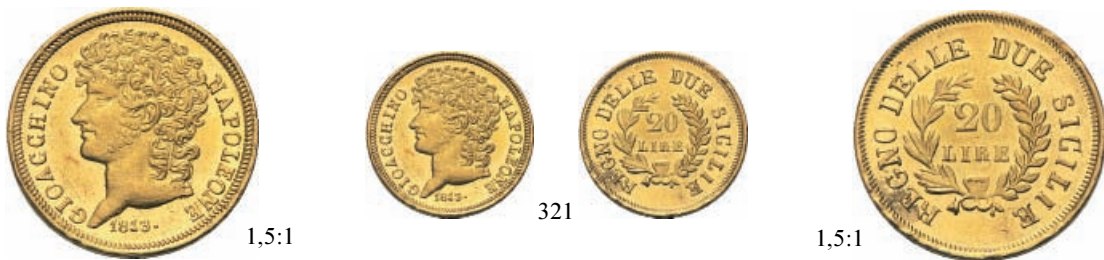
321 20 Lire 1813 rami corti. Au Pag. 56; Pannuti-Riccio 10; Gig. 9. Raro. q. Fdc 2000