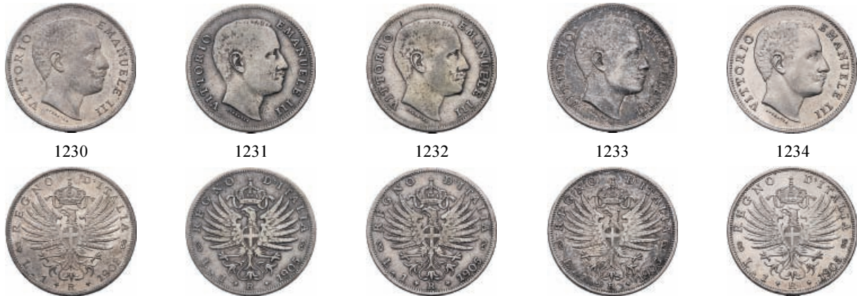
1230 Lira 1902 Aquila sabauda. Ar Pag. 764; Gig. 128.