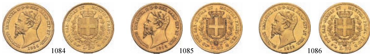
1084 Vittorio Emanuele II, 1849-1861. 20 Lire 1855 Torino. Au Pag. 347; Gig. 10. Colpetti. BB/Spl 250 1085 20 Lire 1858 Torino. Au Pag. 353; Gig. 16. Molto Raro. q. Spl/Spl 600 1086 20 Lire 1859 Genova. Au Pag. 354; Gig. 17. q. Spl 250